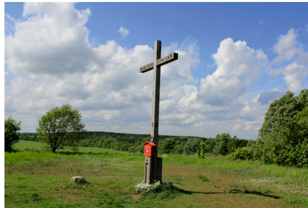
Das höchstgelegene Gipfelkreuz in Brandenburg steht auf dem Hagelberg. Tragen Sie sich in das Gipfelbuch ein!