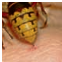
Hornissenstiche sind schmerzhafter als der Stich einer Honigbiene, aber nicht so giftig.

Durchhalten: Hornissen bauen jedes Jahr ein neues Nest. Bleibt das Hornissennest erhalten, wird die Stelle im nächsten Jahr nicht neu besiedelt.